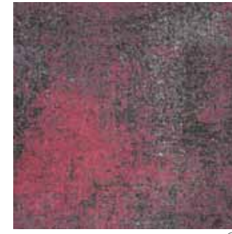
UDR133-137-05 Berry Pink