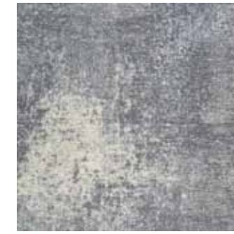
UPY05-219-180 Iced Vanilla