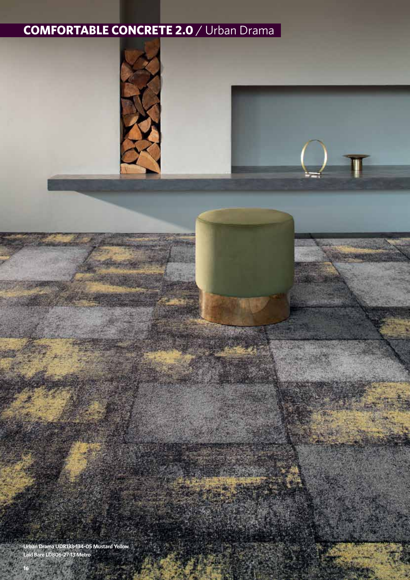
Urban Drama UDR133-134-05 Mustard Yellow Laid Bare LDB06-27-13 Metro