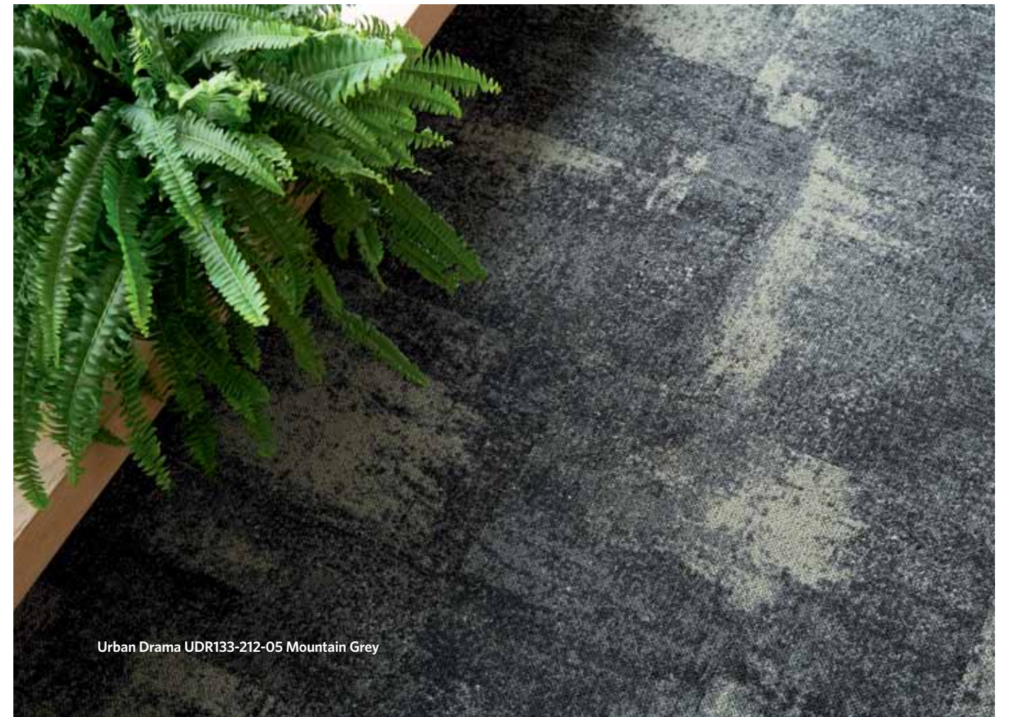
Urban Drama UDR133-212-05 Mountain Grey