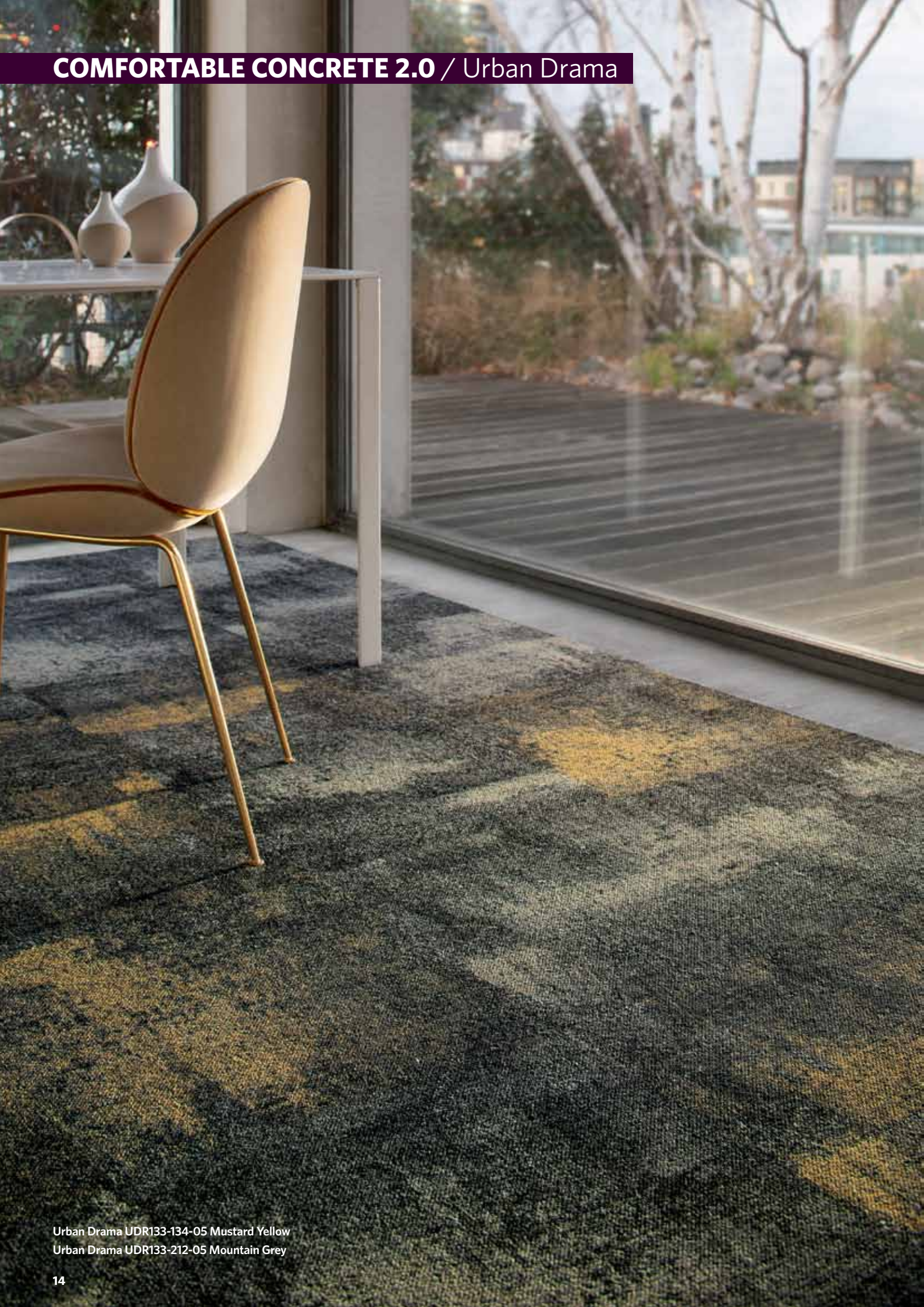
Urban Drama UDR133-134-05 Mustard Yellow Urban Drama UDR133-212-05 Mountain Grey