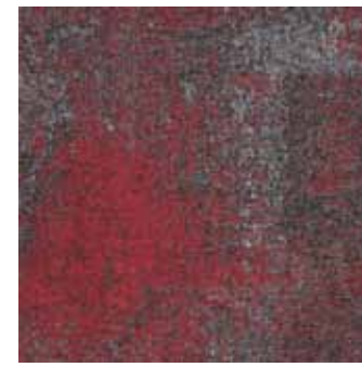
UDR133-109-05 Currant Red