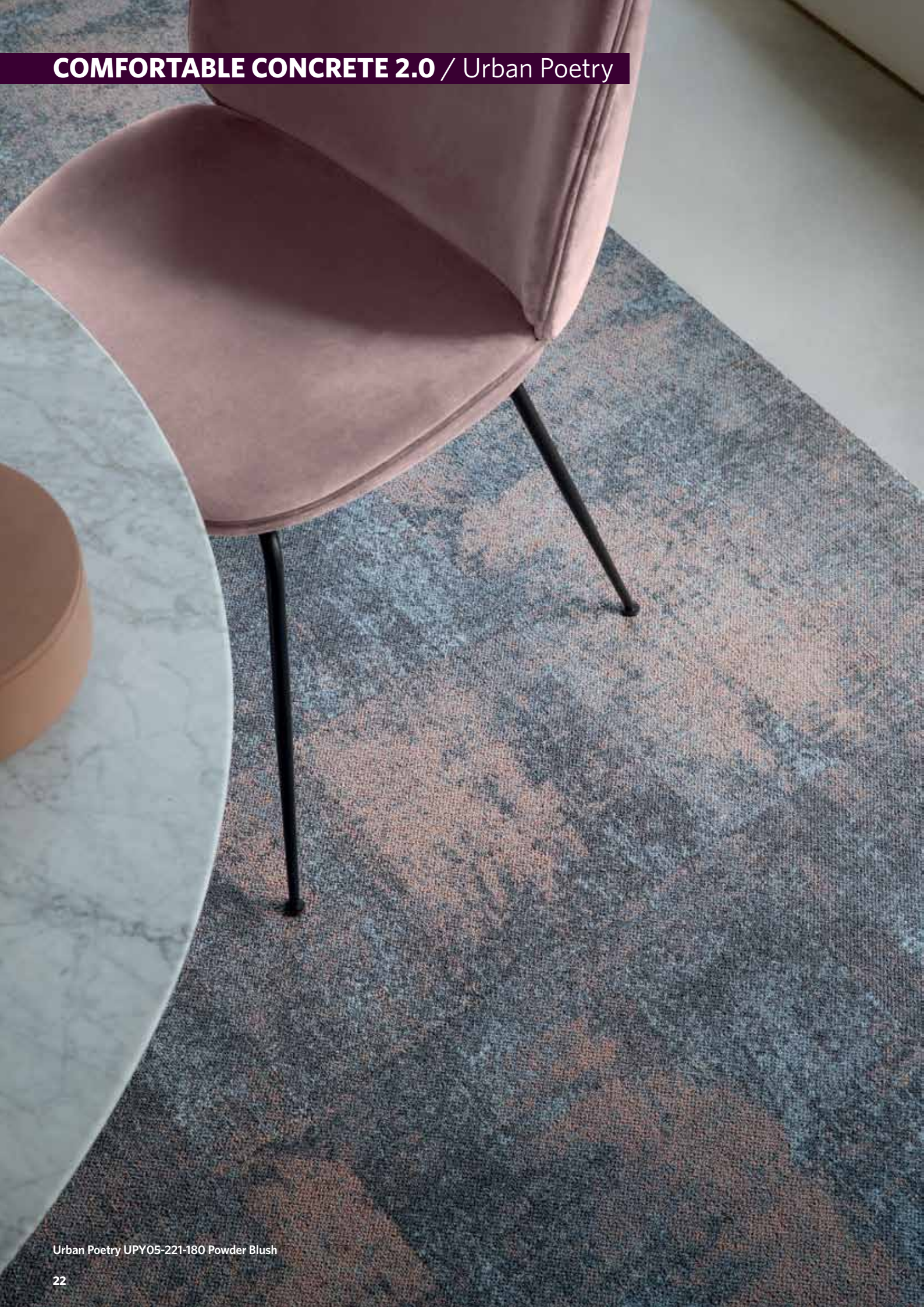
Urban Poetry UPY05-221-180 Powder Blush