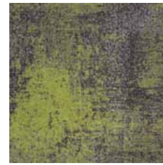
UDR133-141-05 Moss Green