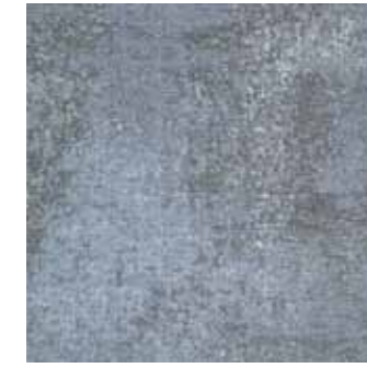
UPY05-242-180 Dusted Lilac