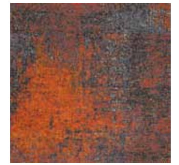
UDR133-190-05 Amber Glow