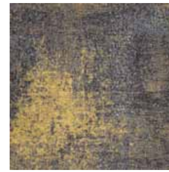
UDR133-134-05 Mustard Yellow