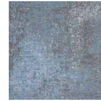
UPY05-245-180 Chalked Blue