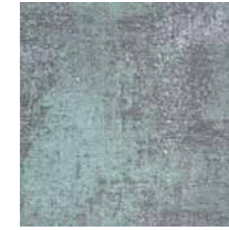
UPY05-172-180 Frosted Mint