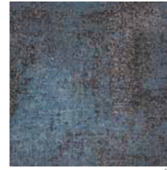
UDR133-126-05 Slate Blue