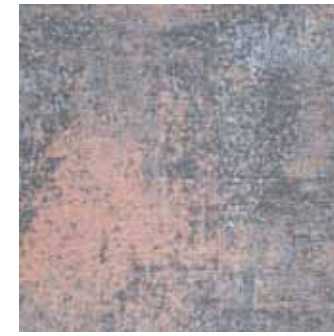
UPY05-221-180 Powder Blush