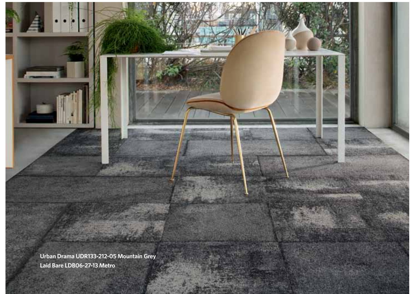
Urban Drama UDR133-212-05 Mountain Grey Laid Bare LDB06-27-13 Metro