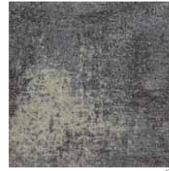
UDR133-212-05 Mountain Grey