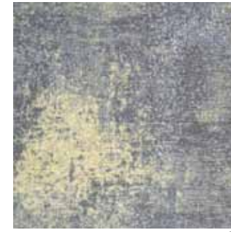
UPY05-111-180 Sherbet Lemon